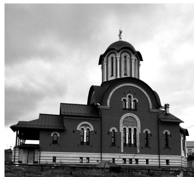
Храм во имя Иверской иконы Божией Матери в селе Богдановка Кинельского района Самарской области

Напутствие духовников, а также наша твёрдая вера, что вокруг храма будет жизнь, которая сбережёт его святыни, приумножит богатые традиции села Богдановка, укре-