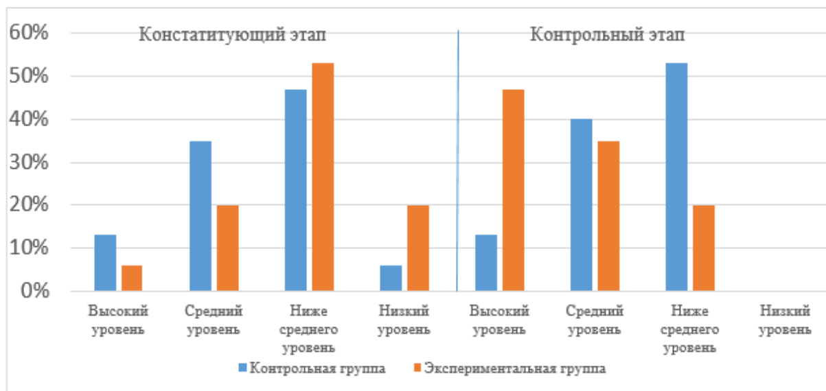
Рисунок 2 – Сравнительные результаты уровня понимания фактического содержания текста (констатирующий и контрольный этапы)

На основе полученных данных построим график (рисунок 2).